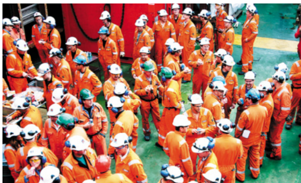
Aksjonerer: ISO-arbeidere.