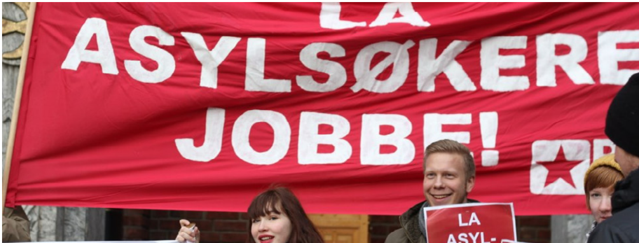
Aksjon: Rød Ungdom aksjonerer for arbeidstillatelse til asylsøkere.