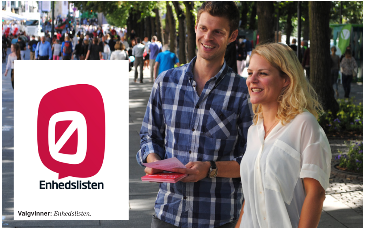
Samarbeid: Rødt-leder Bjørnar Moxnes fikk besøk av Enhedslisterens Johanne Schmidt-Nielsen i stortingvalgkampen.