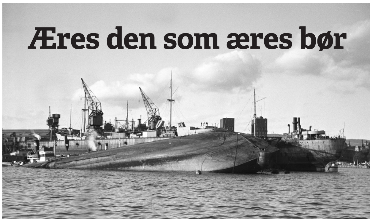
Pelle-gruppas verk: Sabotasjesprengte båter heves ved Akers Mekaniske Verksted sommeren 1946.