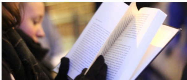
Aksjon: «Politisk høytlesning» utafør Rådhuset 19. november.