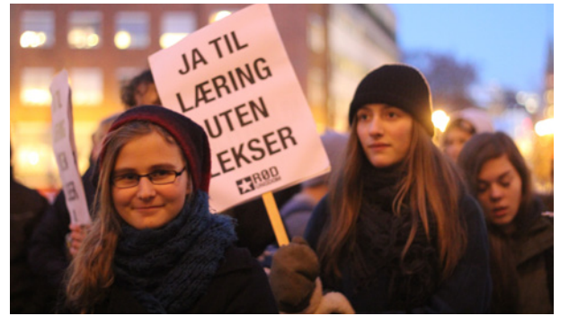
Leksestreik: Fra aksjonen 19. november.

– Prinsippet om «arbeid for alle» bør gjelde nettopp for alle, det er et slikt samfunn Rød Ungdom ønsker at vår generasjon og fremtidige generasjoner skal vokse opp i.