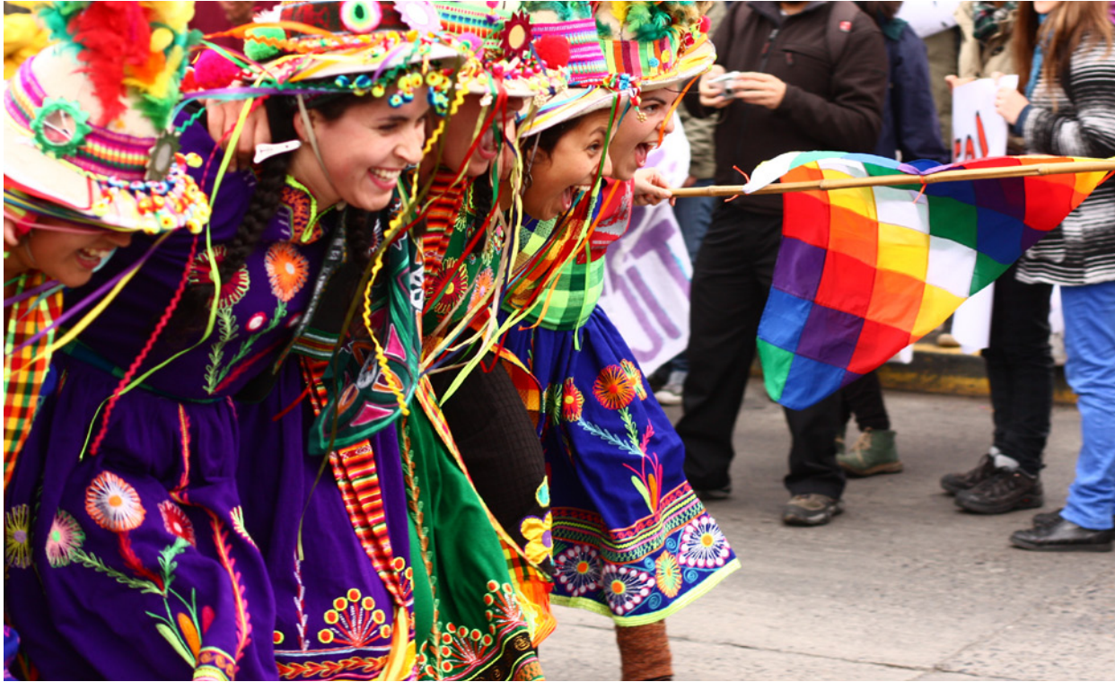
Latin-Amerika: Sterke folkerørsler bidrar til at store deler av Latin-Amerika står i mot kuttpolitikken. Her frå ein demonstrasjon i Chile.