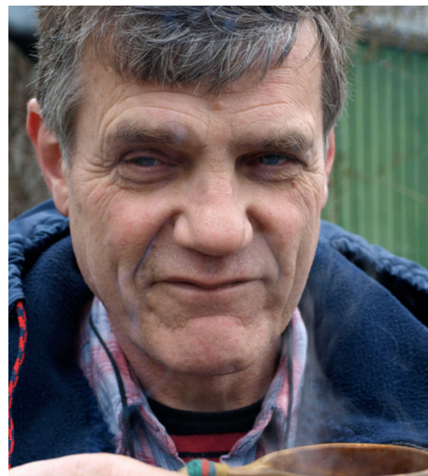
Historiker: Lars Borgersrud.

Det er etter et enstemmig vedtak i Oslo bystyre og langvarig påtrykk fra fagbevegelsen at Pelle-gruppa endelig hedres med et minnesmerke.